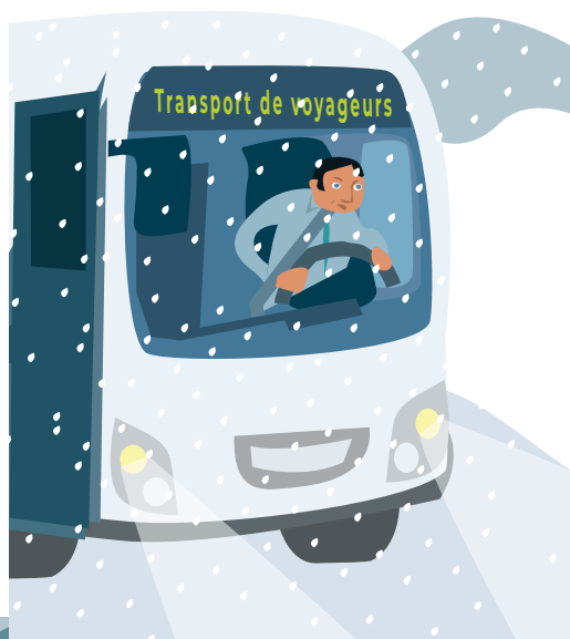
SUR LA ROUTE